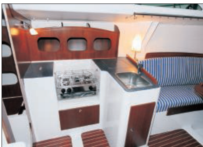
V prostoru pod schody je vlevo umístěna kuchyň s dřezem, vařičem a lednicí.