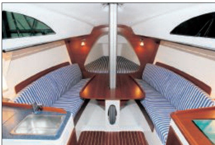
Salon je mimořádně prostorný bez přední pevné přepážky, která by opticky vnitřní prostor přerušovala a zmenšovala.