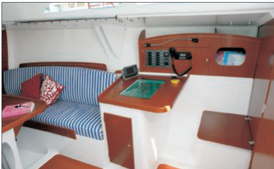
Vpravo pod schody se nachází navigační stůlek.

Použité materiály a úroveň zpracování je na velmi vysokém standardu.