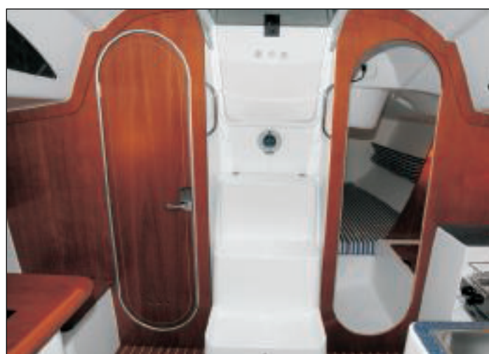
V zadní části loď najdeme oddělenou kajutu s pohodlným dvojlůžkem a koupelnu.

s možností umístění elektrického vrátku. Zajímavým bezpečnostním prvkem je malý provazový žebřík uložený do speciální kapsy na zádi zajištěný jednoduchou nepropustnou zátkou, která je přístupná