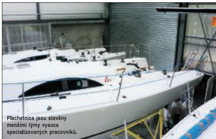
Plachetnice jsou stavěny menšími týmy vysoce specializovaných pracovníků.

plachetnice pro zábavu u vody, Grand Surprise (9,6 m) – další úspěšná loď na poli one-designových 30stopých plachetnic, dvanáctimetrová závodní A40 a současná horká zbraň A35 – plachetnice pro sport i rekreaci.