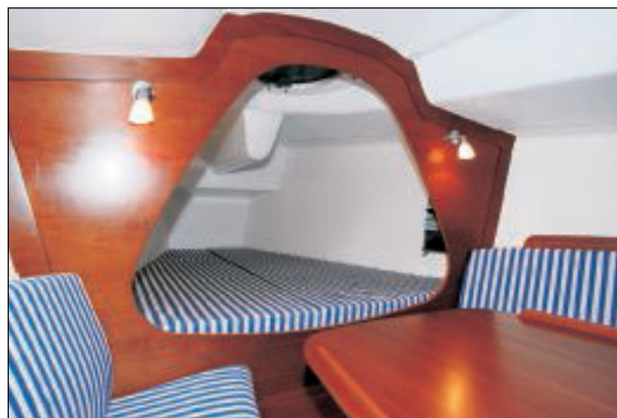
Pro turistické výlety s rodinou a přáteli slouží k oddělení přední kajuty látková posuvná zástěna.