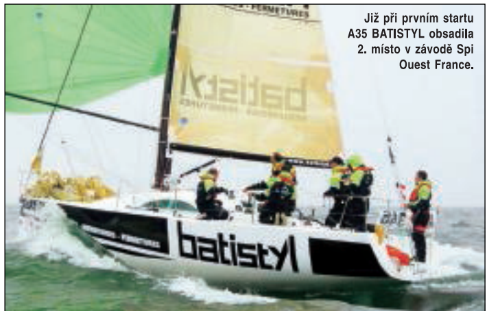
Již při prvním startu A35 BATISTYL obsadila 2. místo v závodě Spi Ouest France.